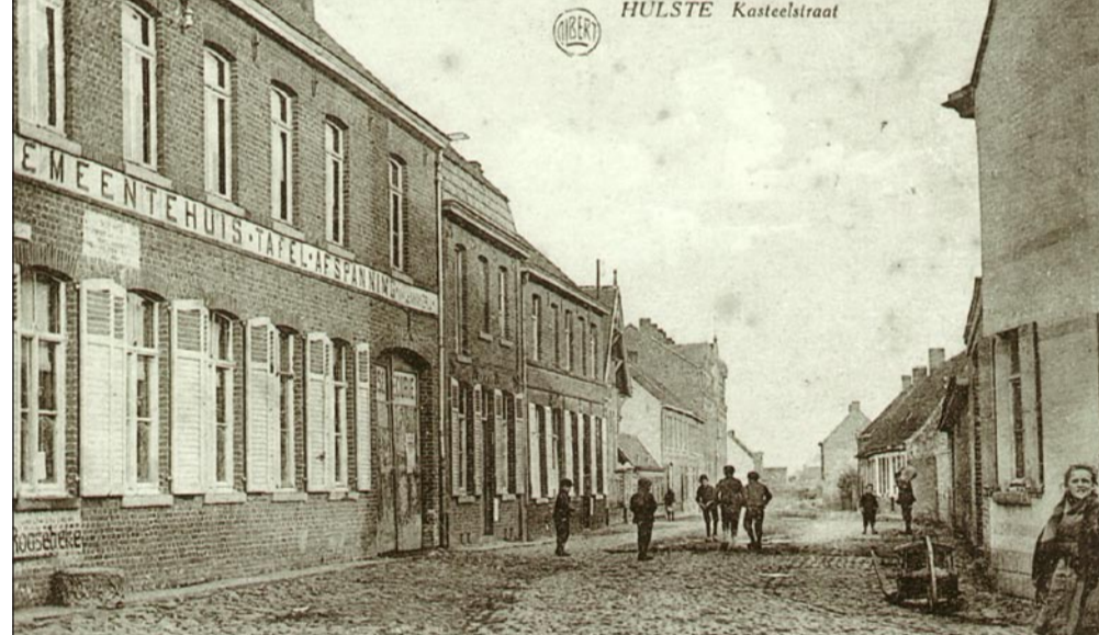
Niet gedateerde prentbriefkaart. Let op de roepsteen links onderaan.