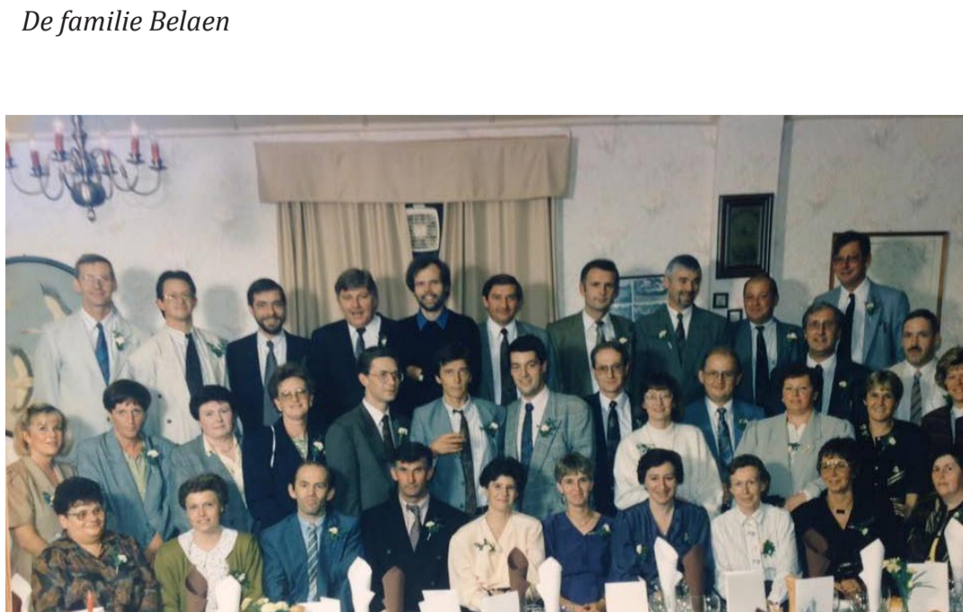
1990 - feest van de 40-jarigen (*1950)