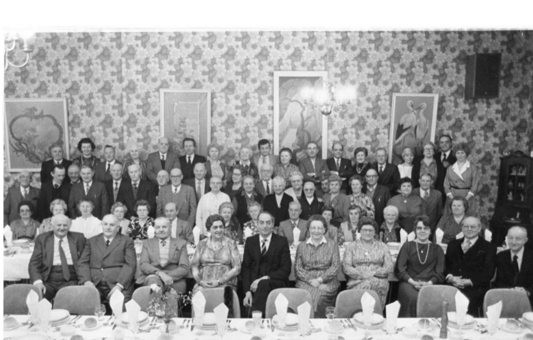
De familie Belaan