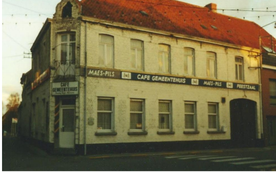
Café Het Gemeentehuis vóór de afbraak

Hulstedorp 19 vormt de hoek van de Tieltsestraat en de Kasteelstraat, sinds 2004 een appartementsgebouw. Ongetwijfeld was hier de belangrijkste herberg van Hulste enerzijds omwille van zijn binding met de bosseniërgilde, eertijds machtig en rijk aan bezittingen, maar ook omdat hier vele jaren het gemeentehuis was.