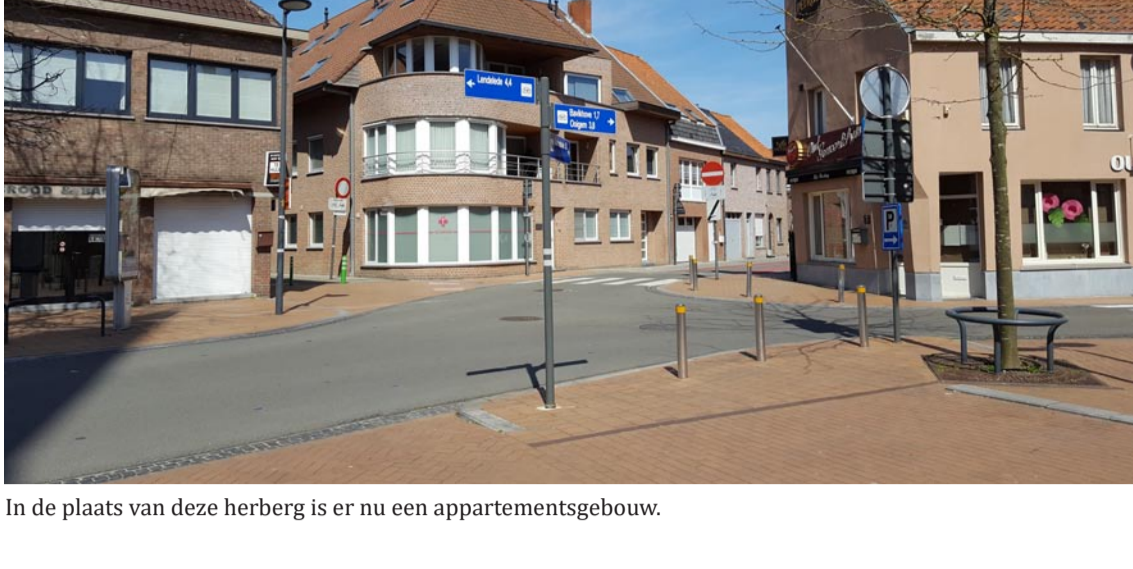
In de plaats van deze herberg is er nu een appartementsgebouw.