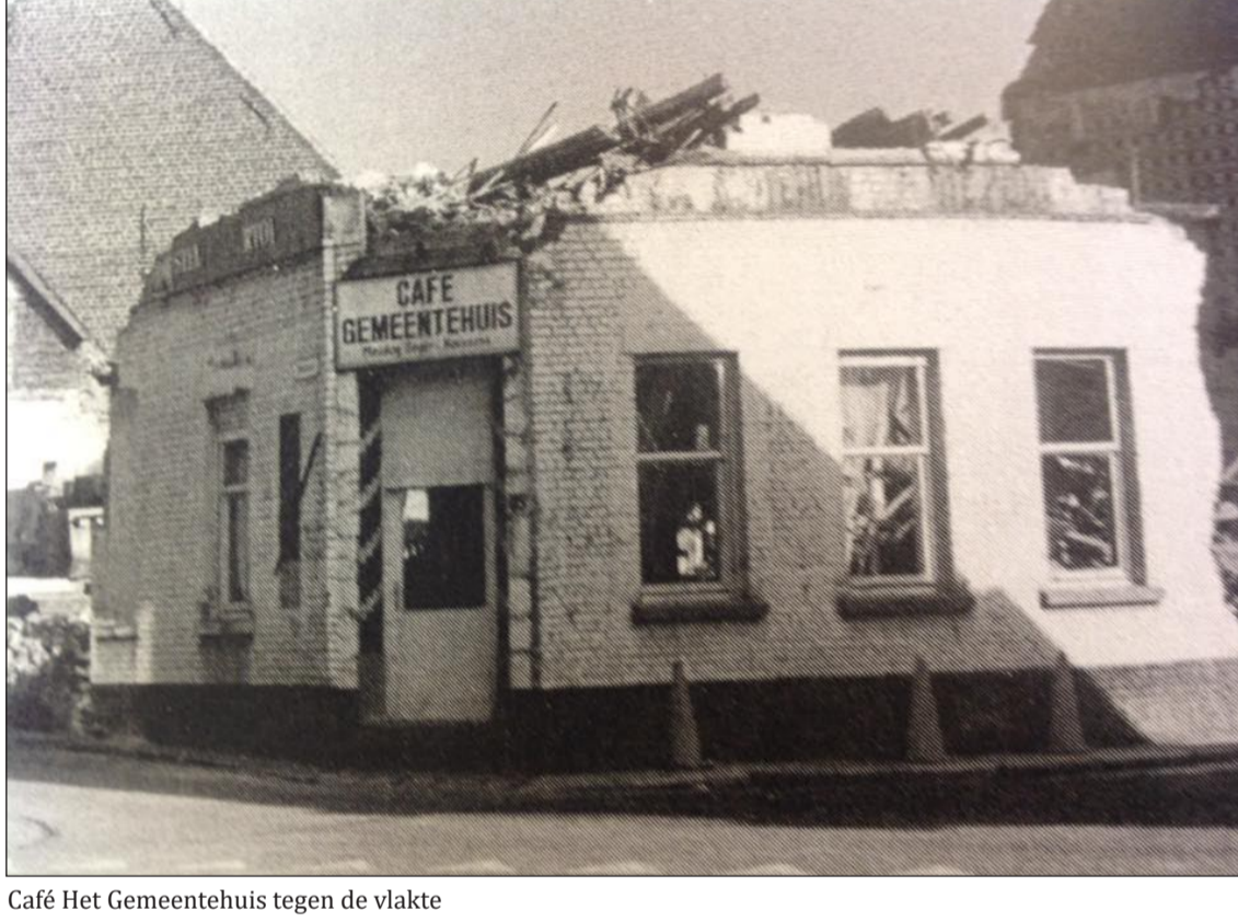
Café Het Gemeentehuis tegen de vlakte